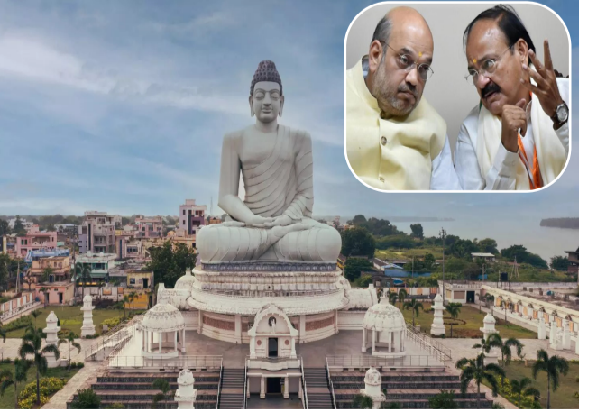
వార్త సంధ్య, అమరావతి, మార్చి 29 : ఆంధ్రప్రదేశ్ ఏకైక రాజధానిగా అమరావతికి చట్టబద్ధత కల్పించే ప్రక్రియ వేగవంతమైంది. ఈ అంశంపై మాజీ ఉపరాష్ట్రపతి వెంకయ్య నాయుడు మరోసారి కీలక చొరవ తీసుకున్నారు. ఆదివారం ఆయన ఢిల్లీలో కేంద్ర హోంమంత్రి అమిత్ షాతో ప్రత్యేకంగా సంప్రదింపులు జరిపారు. ప్రస్తుత పార్లమెంట్ - మిగతా 2 లో