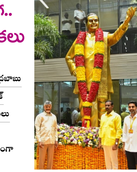
వార్త సంధ్య, అమరావతి, మార్చి 29 : కార్యకర్తలను పట్టించుకోని వాళ్లు, ఇబ్బంది పెట్టే నాయకులు పార్టీకి అవసరం లేదని తెలుగుదేశం అధినేత, సీఎం చంద్రబాబు తేల్చిచెప్పారు. కష్టపడిన వాళ్లను కాపాడుకుంటూ పని చేసిన వాళ్లను గుర్తించి పదవులు ఇచ్చి ప్రోత్సహించామని స్పష్టం చేశారు. ఈ సారి 50 శాతం సీట్లు పెరగడంతో పాటు మహిళలకు 33 శాతం రిజర్వేషన్లు వస్తున్నందున రాజకీయ అవకాశాలు మెరుగుపడతాయని తెలిపారు. తెలుగుదేశం పార్టీ బలంగా ఉంటేనే రాష్ట్రం బలంగా ఉంటుందని ఉద్ఘాటించారు. అమరావతి దేవతల రాజధాని కాబట్టి కొందరు రాక్షసులకు ఇష్టం లేదని జగన్ ను ఉద్దేశించి దుయ్యబట్టారు. పార్టీ కేంద్ర కార్యాలయం ఎన్టీఆర్ భవన్ లో తెలుగుదేశం 44వ అవినీతి దినోత్సవ వేడుకలను ముఖ్యమంత్రి చంద్రబాబు ఘనంగా నిర్వహించారు. టీడీపీ జాతీయ ప్రధాన కార్యదర్శి నారా లోకేశ్, రాష్ట్ర పార్టీ అధ్యక్షులు - మిగతా 2 లో