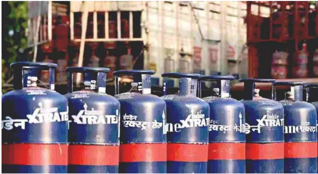
ఎల్పీజీ సిలిండర్ ధరలను ఎలా, ఎక్కడ చెక్ చేయవచ్చు?

వాణిజ్య ఎల్పీజీ గ్యాస్ సిలిండర్ ధర పెంపు వాణిజ్య గ్యాస్ సిలిండర్పై రూ.195 పెంపు దిల్లీలో 19 కిలోల వాణిజ్య ఎల్పీజీ సిలిండర్ ధర రూ. 2,078