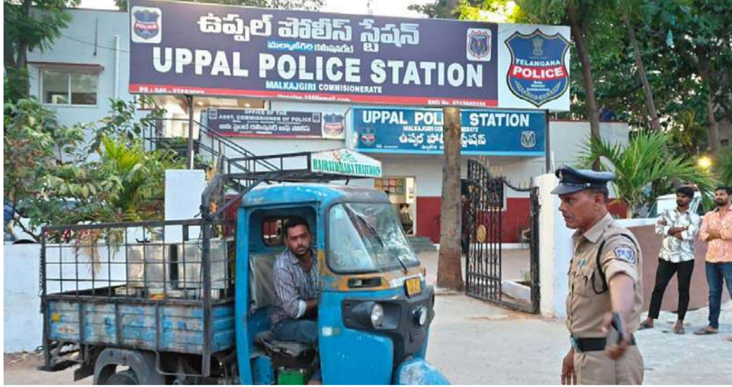
రప్పించి సంయుక్తంగా విచారణ జరపాలని ఉప్పల్ ఎస్సై ప్రయత్నిస్తున్నప్పటికీ, సంబంధిత అధికారుల రాక కోసం పోలీసులు ఎదురుచూచాల్సిన పరిస్థితి ఏర్పడినట్లు సమాచారం.

కేసు సమాధానం అనంతరం స్వాధీనం చేసుకున్న నూనె సమాచారం పరిశీలించేందుకు ఉప్పల్ పరిధిలోని ఆహార భద్రత అధికారిని పోలీసులు సంప్రదించినట్లు తెలిసింది. అయితే సంబంధిత అధికారి "నేను సెలవులో ఉన్నాను" అంటూ సమాధానం ఇచ్చినట్లు సమాచారం. దీంతో కేసు విచారణలో అలస్యం చోటుచేసుకున్నట్లు తెలుస్తోంది. అంతేకాకుండా, నూనె నాణ్యత పరీక్ష కోసం మరోసారి ఫోన్ చేయగా తాము ప్రభుత్వ ప్రసార కార్యక్రమంలో (టెలివీ) ఉన్నానని, ఇతర అధికారులను సంప్రదించాలని సూచించిన ఘటన కొనసాగుతూ మారింది. ప్రజల ఆరోగ్యానికి సంబంధించిన అత్యవసర అంశంలో బాధ్యతాయతంగా స్పందించాల్సిన అధికారులు నిర్లక్ష్యంగా వ్యవహరించారని స్థానికులు విమర్శిస్తున్నారు. ఇక జీహెచ్ఎస్ఐ (మహానగర పాలక సంస్థ) అధికారులను కూడా పోలీస్ స్టేషన్కు