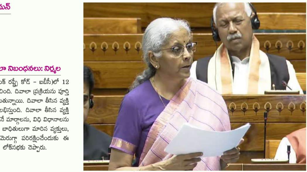
ఉండని ఆర్థిక మంత్రి నిర్వలా.

అవరోధాలకు సవాళ్లు, అంతర్జాతీయ ప్రమాణాలకు అనుగుణంగా దివాలా చట్టంలో మరొక సవరణను చేశారు. కేంద్ర ఆర్థిక మంత్రి నిర్వలా సీతారామన్ లోక్సభకు తెలిపారు. ఈ మార్పులు వల్ల దేశ బ్యాంకింగ్ రంగం ఆరోగ్యం మరింత మెరుగుపడుతుందని ఆమె చెప్పారు. ఈ సవరణ బిల్లుకు లోక్సభ సభ్యుల కమిటీ చేసిన అన్ని సిఫార్సులు ఆమోదాన్ని పొందాలని నిర్వలా వెల్లడించారు. పెట్టుబడిదారుల విశ్వాసాన్ని పెంచే ఉద్దేశంతో కార్పొరేట్ వ్యాపార గ్రూపులలో, విదేశాల్లోని వ్యక్తులు, సంస్థలతో దివాలా విషయాలను పరిష్కరించుకునే విధానాలను అందుబాటులోకి తెచ్చామన్నారు. దివాలా తీసిన వ్యక్తులు, సంస్థలు కోర్టు అవతలి వ్యవస్థల ద్వారా 150 రోజుల్లోగా పరిష్కారాలను పొందొచ్చని ఆమె తెలిపారు. నేషనల్ కంపెనీ లా (ట్రీబ్యూనల్, డెడ్లెడ్ రికవరీ ట్రీబ్యూనల్ దివాలా పిటిషన్ దాఖలైన 30 రోజుల్లోగా దాన్ని ఆమోదించడమే, తిరస్కరించడమే చేయాలనే నిబంధన కూడా నూతన సవరణల్లో