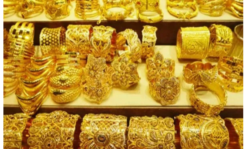
ఈ రోజు తగ్గుదలతో పసిడి రేటు ఎంత వరకు పడిపోయిందంటే..

బంగారం ధరలు శాంతించాయి. గత కొంత కాలంగా భారీగా పెరుగుతూ వచ్చిన పసిడి ధరలు నేల చూపుతున్నాయి. అంతర్జాతీయంగా నెలకొన్న ఉద్రిక్తతలతో దాలర్ విలువ పుంజుకునే పరిస్థితులు కనిపిస్తున్నాయి ఈ నేపథ్యంలో పెట్టుబడిదారులు దాలర్ ఆధారిత ఆస్తుల మీదకు పెట్టుబడులను మళ్ళిస్తున్నారు. దీంతో పసిడి బంగారం తగ్గుముఖం పడుతున్నాయి. సాధారణంగా వార్ ప్రభావంతో బంగారం ధరలు పెరగాలి. అయితే ఈ సారి అందుకు విరుద్ధంగా జరుగుతోంది. ఇరాన్ యుద్ధ ప్రభావం బంగారం ధరల మీద అంతగా ప్రభావం చేపడడం లేదు. ఈ రోజు ధరలను ఓ సారి చూసినట్లయితే భారీగా తగ్గుముఖం పట్టాయని చెప్పవచ్చు. ఏప్రిల్ 6, సోమవారం దేశంలో బంగారం ధరలను ఓ సారి పరిశీలిస్తే.. 24 క్యారట్ల గ్రాముల ధర రూ. 180 తగ్గి రూ. 14,913 వద్ద త్రోవైతే, ఇక 22 క్యారట్ల గ్రాముల బంగారం ధర రూ. 165 తగ్గి రూ. 13,670 వద్ద త్రోవైతే అవుతోంది. అలాగే 18 క్యారట్ల గ్రాముల బంగారం ధర రూ. 135 తగ్గి రూ. 11,185 వద్ద త్రోవైతే అవుతోంది. 100 గ్రాముల 24 క్యారట్ల బంగారం ధర రూ. 18,000 తగ్గి రూ. 14,91,300 వద్ద త్రోవైతే అవుతోంది. అలాగే 22 క్యారట్ల బంగారం ధర 100