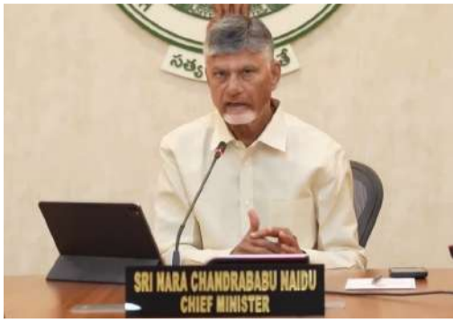
గృహం హాజీ క్యాంటం వ్యాఖ్యలు

మొదటివేళ తరువాయి - బలమైన పునాదులు వేస్తున్నారు. హార్డ్వేర్ తయారీకి కేంద్రంగా అమరావతి కేవలం సాఫ్ట్వేర్ అభివృద్ధిపైనే పరిమితం కాకుండా క్యాంటం కంప్యూటర్ హార్డ్వేర్ తయారీలోనూ స్వయం సమృద్ధి సాధించాలన్నది ముఖ్యమంత్రి చంద్రబాబు లక్ష్యం.