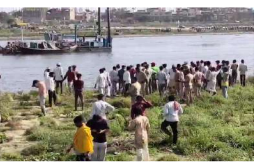
అగ్నిమాపక సిబ్బంది, స్థానిక గజ ఉతగాళ్లు ఘటనా స్థలానికి చేరుకుని సహాయక చర్యలు చేపట్టారు.

మొదటివేళ తరువాయి - ఉత్తరప్రదేశ్ లోని మధుర జిల్లాలో ఘోర పడవ ప్రమాదం జరిగింది. బృందావన్ లోని కేపిటాల్ వద్ద యుమానా నదిలో యాత్రికులతో వెళ్తున్న పడవ బోల్తా పడటంతో 10 మంది మృతి చెందారు.