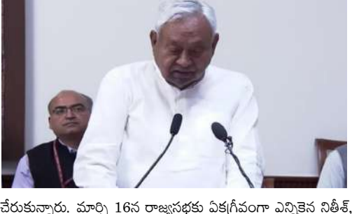
చేరుకున్నారు. మార్చి 16న రాజ్యసభకు ఏకగ్రీవంగా ఎన్నికైన నితీష్,

మొదటివేళ తరువాయి - బీహార్ ముఖ్యమంత్రి నితీష్ కుమార్ తన సుదీర్ఘ రాజకీయ ప్రస్థానంలో కీలక మలుపు తీసుకున్నారు. తనోజు ఆయన రాజ్యసభ సభ్యుడిగా ప్రమాణస్వీకారం చేశారు.