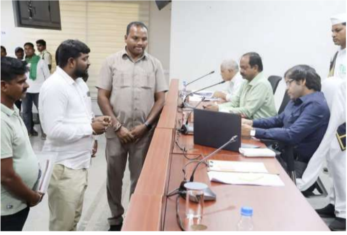
దాదాపు 55 కిలోమీటర్ల దూరంలో ఉండటంతో సిబిందర్ తీసుకురావడం కోసం ఎక్కువ దూరం ప్రయాణించాల్సి వస్తోంది.

గ్యాస్ మార్కుపై రేగజ్జ ప్రజల ఆందోళన ప్రజావాణి లో కలెక్టర్ కి వివరిత రేగజ్జ పెద్దతండ్ల సర్పంచ్ పూర్ణ భద్రాద్రి జిల్లా బ్యారో, ఏప్రిల్ 13 (వార్త సంద్య) : లక్ష్మీదేవిపల్లి మండలంలోని ఉమ్మడి రేగజ్జ గ్రామ వచాయతీ పరిషత్ గ్యాస్ కనెక్షన్ల మార్పు ప్రజలకు తీవ్ర ఇబ్బందులను తెచ్చిపెట్టింది. రేగజ్జ, పెద్ద తండ్ల, బావోజీ తండ్ల, హరిరాజు తండ్ల, దుర్గా తండ్ల గ్రామాలకు చెందిన ప్రజలు గత 20 సంవత్సరాలుగా సత్సేవీల్ గ్యాస్ ఏజెన్సీ ద్వారా ఇంటియన్ గ్యాస్ సేవలను సులభంగా పొందుతూ వచ్చారు. వచాయతీ పరిషత్ సుమారు 2000 గ్యాస్ కనెక్షన్లు ఉండగా, ఇటీవల జనవరి నెలలో ఈ కనెక్షన్లను ఆళ్లపల్లి మండలంలోని శ్రీ సమృద్ధి సారక్క గ్యాస్ ఏజెన్సీకి మార్చడం జరిగింది. ఈ మార్పుతో ప్రజలు తీవ్రమైన ఇబ్బందులు ఎదుర్కొంటున్నారు. కొత్తగా కేటాయించిన గ్యాస్ ఏజెన్సీ గ్రామానికి