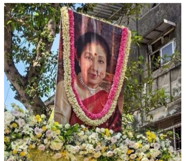
వార్త సంధ్య ముంబై, ఏప్రిల్ 13: భారతీయ సినీ సంగీత ప్రపంచంలో ఒక శకం ముగిసింది. దిగ్గజ గాయని, స్వర సామ్రాజ్ఞి ఆశా భోంస్లే (92) వంచభూతాల్లో లీనమయ్యారు. ముంబైలోని శివాజీ పార్క్ వ్యూశానవాటిలో సోమవారం సాయంత్రం ఆమె అంత్యక్రియలు పూర్తి ప్రభుత్వ లాంఛనాలతో జరిగాయి. సూర్యాస్తమయ వేళ, అశ్రునయనాల మధ్య ఆమెకు తుది వీడ్కోలు పలికారు. కుటుంబ సభ్యులు, రాజకీయ ప్రముఖులు, అభిమానుల సమక్షంలో వేద మంత్రోచ్ఛారణలతో తుది సంతకాలు నిర్వహించారు. ఈ సందర్భంగా పోలీసులు గాలిలో మాడు రౌండ్లు కాల్చులు బిబి గౌరవ వందనం సమర్పించారు. అనంతరం పోలీస్ బ్యాండ్ సభ్యులు 'లాస్ట్ పోస్ట్' వాయిస్తూ ఆమెకు సైనిక లాంఛనాలతో నివాళి అర్పించారు. అంతకుముందు ఆమె నివాసం నుంచి శివాజీ పార్క్ వరకు భారీ ఊరేగింపుతో అంతిమయాత్ర సాగింది. ఆశా భోంస్లే ఏప్రిల్ 12న ముంబైలోని బ్రిట్ క్యాండ్ ఆసుపత్రిలో తుదిశ్వాస విడిచారు. గుండెపోటుతో ఆసుపత్రిలో - మిగతా 2 లో