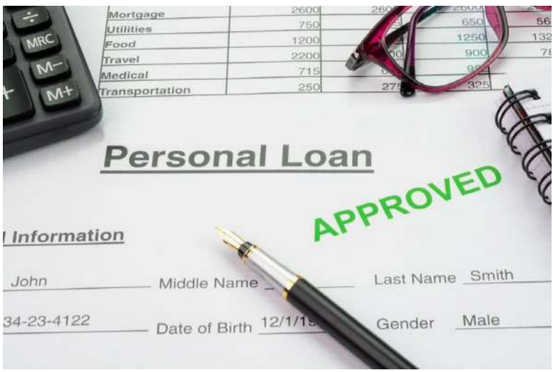
జాగ్రత్తగా చదవాలి. అవసరం అడిగి తెలుసుకున్నాకే అప్రెమియం ఓకే చెప్పి లోన్ తీసుకోవడం బెటర్ అంటున్న నిపుణులు.