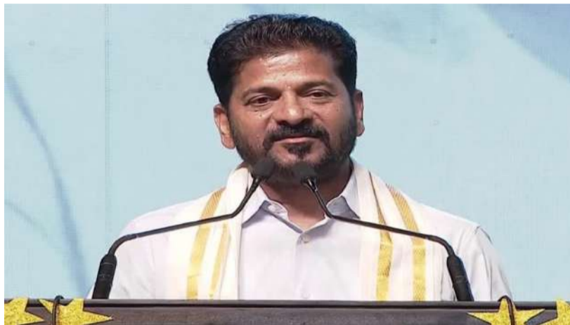
వార్త సంధ్య హైదరాబాద్, ఏప్రిల్ 13: మహిళా రిజర్వేషన్లు, నియోజకవర్గాల పునర్విభజన అనేవి రేచ ప్రజలందరికీ సంబంధించిన అంశాలని సీఎం రేవంత్ రెడ్డి తెలిపారు. కానీ, బీజేపీ మాత్రం తమ సొంత వ్యవహారం అన్నట్లుగా వ్యవహరిస్తోందని విమర్శించారు. మహిళా రిజర్వేషన్లు, డిలిమిటేషన్ కలిపి తీసుకురావడం, పాత జనాభా లెక్కల ప్రకారం వెళ్లడం వెనుక కుట్ర దాగి ఉందని ఆరోపించారు. ఎన్టీయే - మిగతా 2 లో