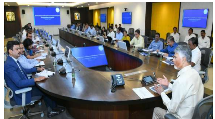
వార్త సంధ్య అమరావతి, ఏప్రిల్ 13: ఆంధ్రప్రదేశ్ లో పారిశ్రామిక ప్రగతికి ఊతమిచ్చే దిశగా ముఖ్యమంత్రి చంద్రబాబు కీలక నిర్ణయాలు తీసుకున్నారు. పరిశ్రమల ఏర్పాటు ప్రక్రియను వేగవంతం చేసేందుకు, అనవసర నిబంధనలను తొలగించేందుకు ఉద్దేశించిన కేంద్ర ప్రభుత్వ డి-రెగ్యులేషన్ ఫేజ్-2 ప్రతిపాదనలపై సోమవారం ఆయన ఉన్నత స్థాయి సమీక్ష నిర్వహించారు. కేంద్ర ఉక్కు శాఖ కార్యదర్శి నందీష్ పొండ్రీక్ నేతృత్వంలోని ప్రతినిధి బృందంతో పాటు, రాష్ట్ర ప్రభుత్వ ప్రధాన కార్యదర్శి, ఇతర ఉన్నతాధికారులతో చంద్రబాబు సమావేశమయ్యారు. - మిగతా 2 లో