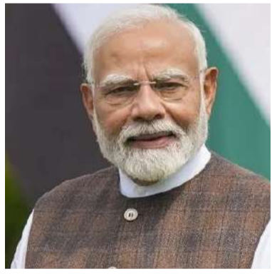
వార్త సంధ్య ఢిల్లీ, ఏప్రిల్ 13: చట్టసభల్లో దీర్ఘకాలంగా వెండింగ్ లో ఉన్న మహిళా రిజర్వేషన్ బిల్లు త్వరలో చట్టం కానుందని, తద్వారా భారతదేశం సరికొత్త చరిత్రను లిఖించనుందని ప్రధానమంత్రి నరేంద్ర మోదీ అన్నారు. ఈ 21వ శతాబ్దంలోనే అతిపెద్ద నిర్ణయాల్లో ఒకదానిని భారత్ - మిగతా 2 లో